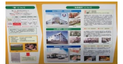
印南養鶏農業協同組合のご紹介