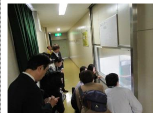
見学通路にて視察